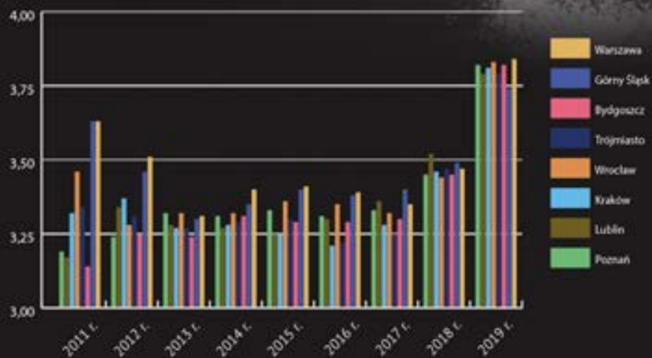
Ceny chleba w wybranych miastach (w złotych)